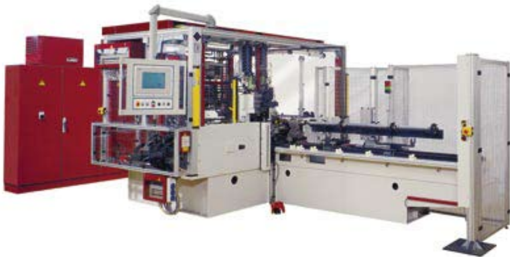
Abb. rechts: Bevor die INA-Motorelemente das Haus verlassen, werden sie in diesem Automaten montiert und geprüft.

Abb. links und Mitte: Hier werden Gelenkwellen montiert und vermessen. Dank eccscad kann man die Schaltpläne künftig direkt auf dem Bedien-Monitor ansehen.