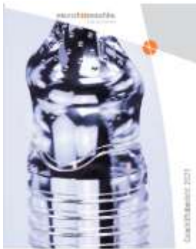
MuM GB 2021

Sie sind bekannt dafür, die Titelseite des Geschäftsberichts mit besonderem Bedacht auszuwählen. Was ist die Story hinter dem aktuellen Foto?