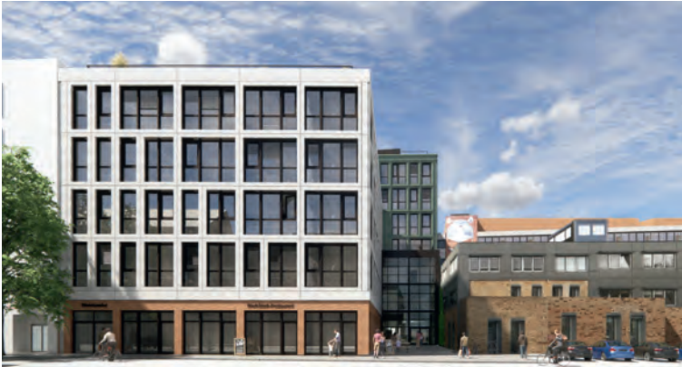
Raum zum Arbeiten, zum Denken, zum Kreativ-Sein: Neben dem gelben Backsteinbau der WerkStadt Sendling entsteht das NewOffice NOW.