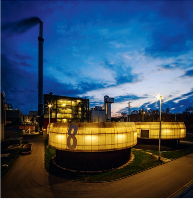
Der nächste Schritt steht schon an: Eine P&ID-Lösung für das Hauptklärwerk – natürlich mit Unterstützung von MuM.