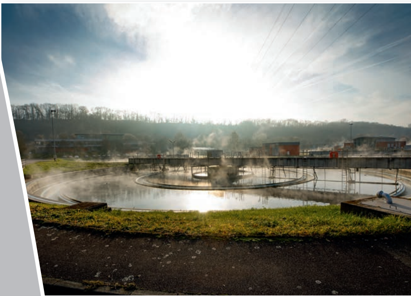
„KWISS“ liefert die Daten über das Hauptklärwerk und drei Außenklärwerke.

Mit Customizing von MuM hat das Tiefbauamt Stuttgart sein Klärwerk-Informationssystem vereinheitlicht und modernisiert