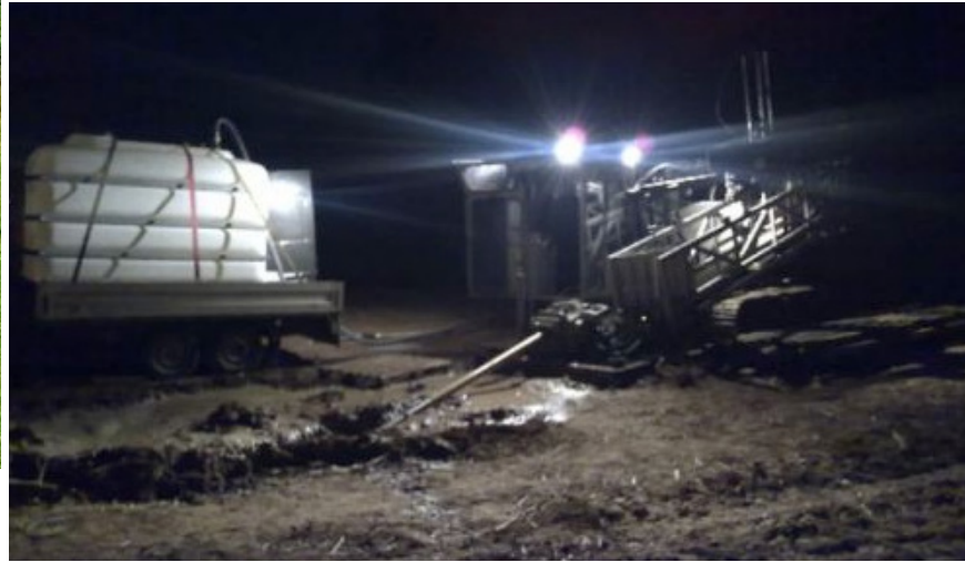
Tag und Nacht im Einsatz: Die HDD-Anlagen (Horizontal Direction Drilling) sind bei den Kunden heiß begehrt.